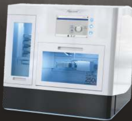
CORTEC 250i Loader PRO