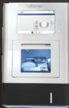
CORTEC 150i dry | 150i PRO